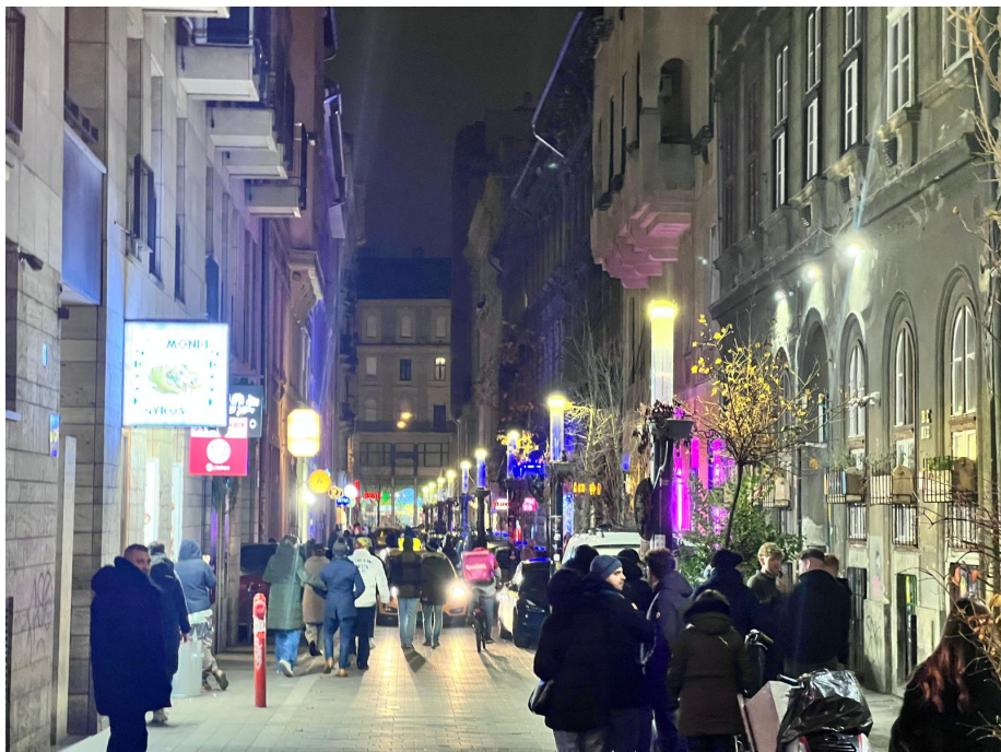
Kép 1,2: Tipikus esti gyalogos- és autóforgalom a Kazinczy utcában