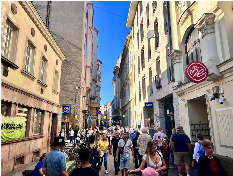
Kép 3: Kazinczy utca a Színes Erzsébetváros Egyesület által rendezett utcafesztivál idején (2024. szeptember)

A helyzet megoldása nem tűr további halasztást. Mint ahogy a történelmi belvárosban sok helyen már évtizedek óta bevált a gépjárműforgalom kitiltása, az utcahálózat egyes elemeinek sétálóutcává alakítása (kezdve az V. kerületi Váci utca környékével és a Vörösmarty térrel, de említhetnénk itt a VIII. kerületi Palotanegyed egyes részeit is is), úgy azt most időszerű a Belső-Erzsébetváros leginkább érintett utcáira is kiterjeszteni. Ennek különös aktualitást ad az a helyi lakók, valamint kulturális és közéleti szereplők, szervezetek által is támogatott kezdeményezés amely szerint a Kazinczy utca, Dob utca, Madách Imre út, Asbóth utca és a Kis Diófa utca alakuljon gyalogos övezetté, vállalva egyúttal azt is, hogy a közterületeket utcabútorok, konténeres növények telepítésével teszik élhetőbbé. A beavatkozás így lehet tesztjellegű, fél éves időszak után kiértékelhető.